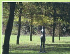
Jardins de Bois Guilbert 76750 Bois Guilbert