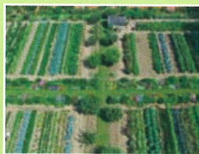
Chateau de Miromesnil 76550 Tourville s/Arques

En 2010, les aides ainsi apportées ont été au nombre de quatre :